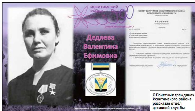
О Почетных гражданах Искитимского района рассказал отдел архивной службы

В рамках мероприятий, посвященных 90-летию района, специалисты отдела архивной